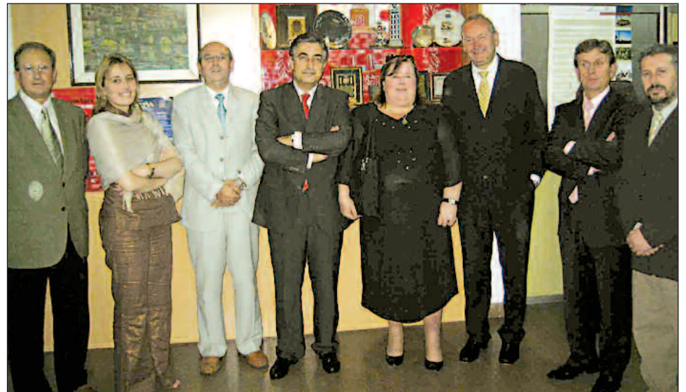
Diferentes momentos de viaje de la Diputación de A Coruña a Argentina